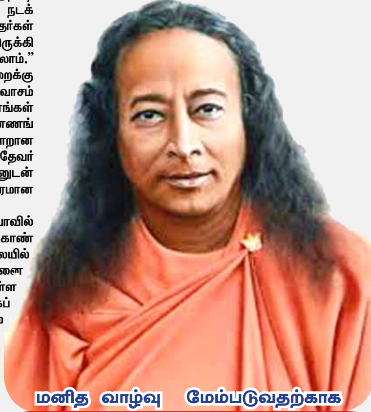
மனித வாழ்வு மேம்படுவதற்காக

மனிதனுடைய அன்புதான் அவன் இறைவனுக்கு அளிக்கும் ஒரே பரிசு பரமஹம்ஸர் கூறுகிறார்: “மனிதனை சோதிப்பதற்காகவே முழு படைப்புத் திட்டமிடப்பட்டுள்ளது. உலகில் நம்முடைய நடத்தையின் மூலம் இறைவனை விரும்புகிறோமா என்பதை நாம் வெளிப்படுத்துகிறோம். எல்லாவற்றையும்விட இறைவனைத்தான் விரும்பவேண்டும் என்று அவன் உங்களிடம் கூறமாட்டான். ஏனெனில் எந்தவிதமான ‘தூண்டலும்’ இன்றி உங்களுடைய அன்பு நிபந்தனையின்றி கொடுக்கப்படவேண்டும் என்று அவன் விரும்புகிறான். இந்தப் பிரபஞ்ச லீலையின் முழு இரகசியமும் இதுதான். நம்மைப்